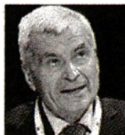
Carlo Sangalli presidente di Unioncamere